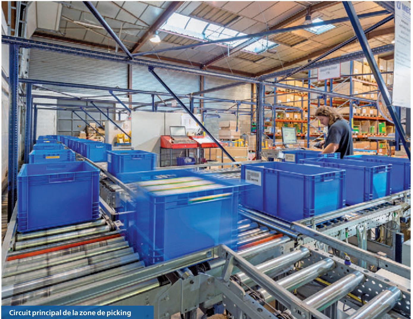
Circuit principal de la zone de picking