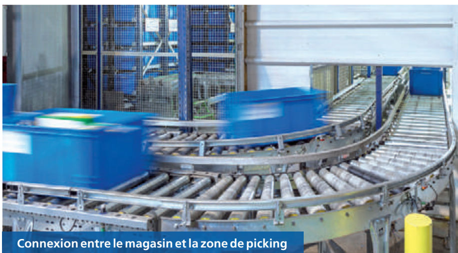
Connexion entre le magasin et la zone de picking