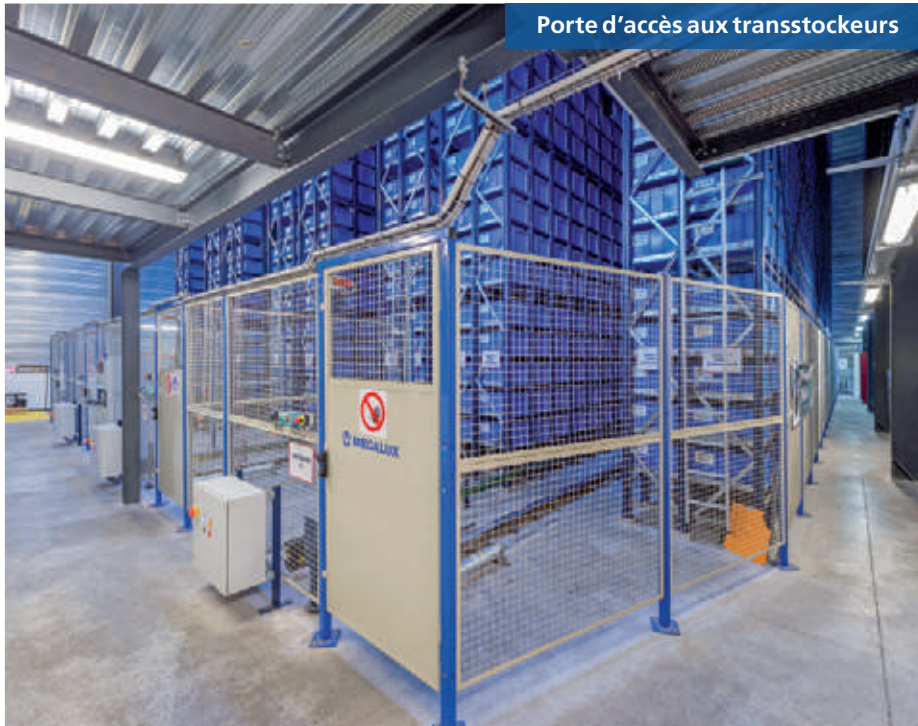
Porte d'accès aux transstockeurs