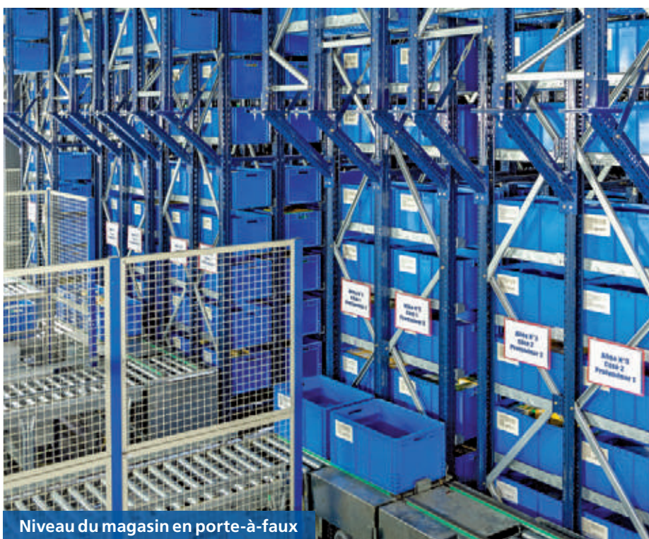
Niveau du magasin en porte-à-faux

Sur la partie arrière, qui abrite une grande zone dédiée à la maintenance, on y trouve des dispositifs de référence pour positionner le transstockeur. L'espace est fermé par des panneaux grillagés et des portes d'accès sécurisé qui couperaient individuellement l'alimentation électrique des machines, en cas d'ouverture.