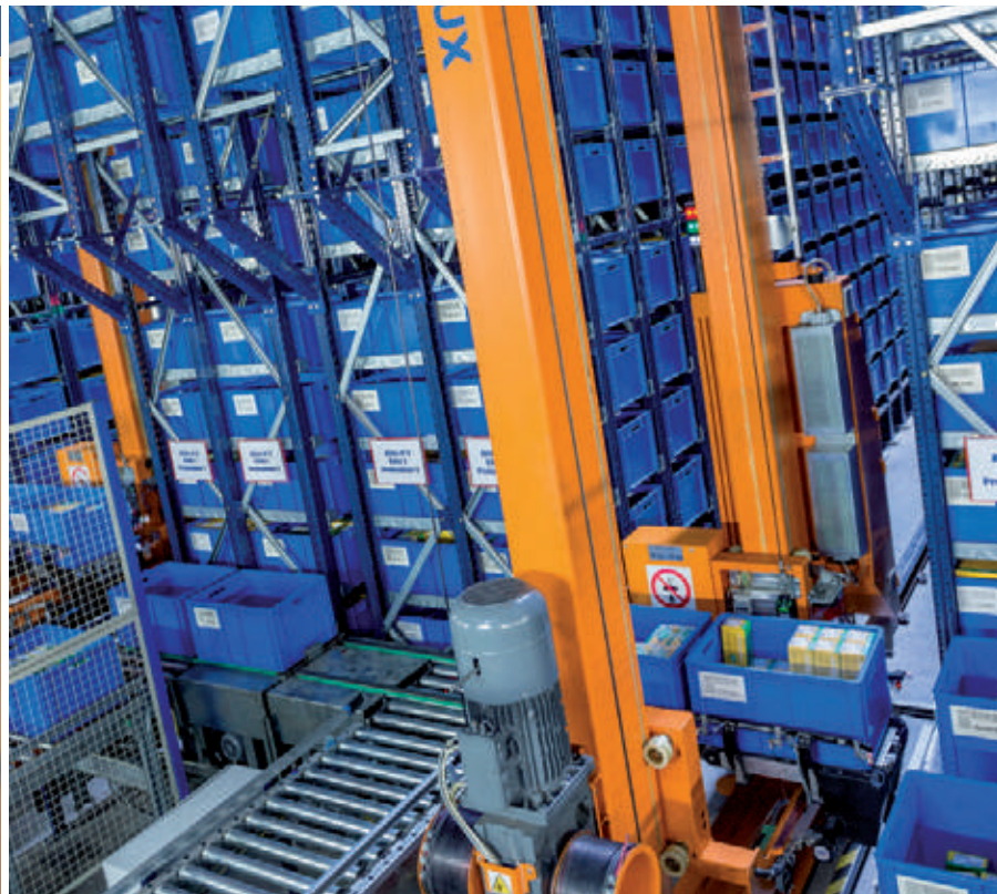
Miniload avec convoyeurs à l'intérieur du magasin