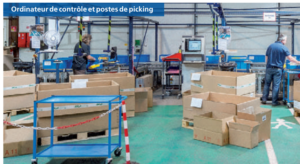
Ordinateur de contrôle et postes de picking

Trois postes de picking, une zone de réapprovisionnement et une aire de consolidation ont été aménagés