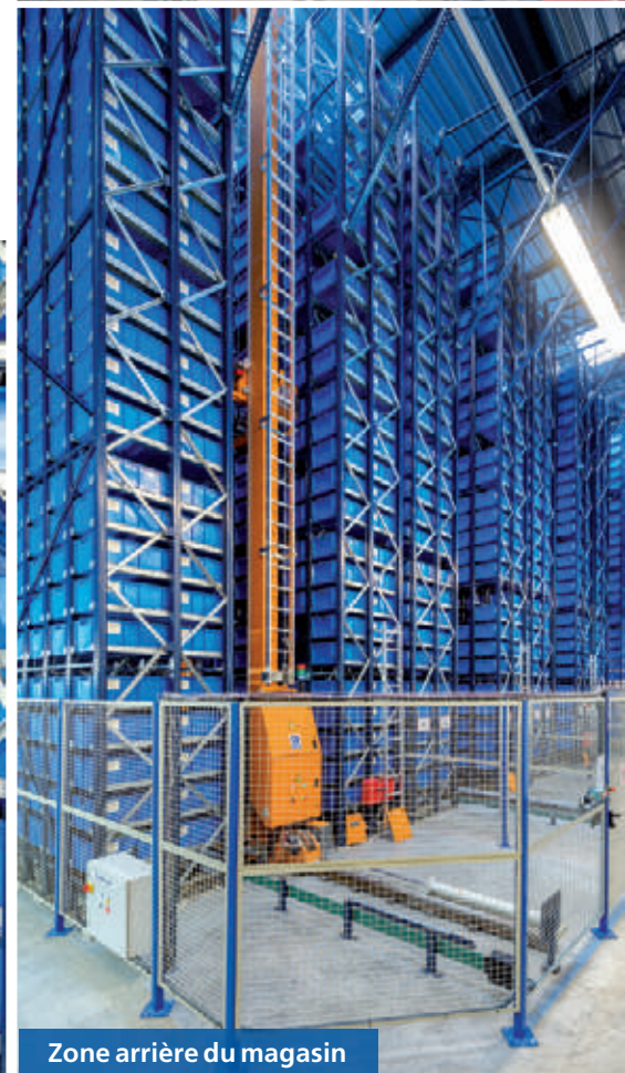
Zone arrière du magasin