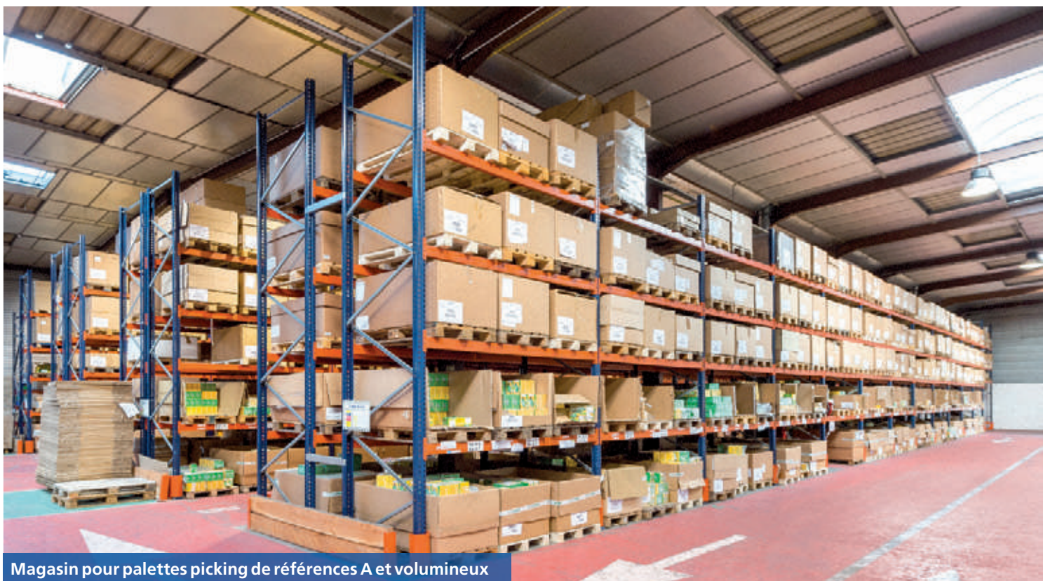
Magasin pour palettes picking de références A et volumineux